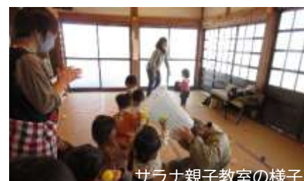
サラナ親子教室の様子