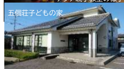
五個荘子どもの家