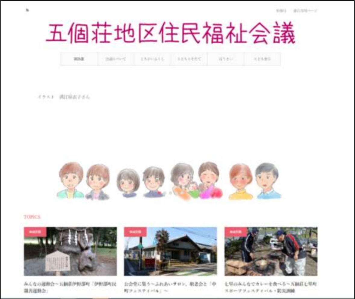
図1 五個荘地区住民福祉会議ホームページ（トップページ）