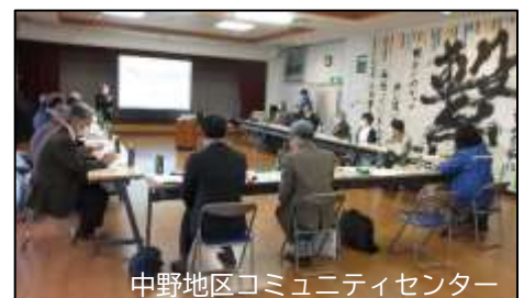
中野地区コミュニティセンター

※今回はコロナ禍のため、運営コア会議メンバー、各 リーダー、サブリーダー等参加人数を制限して実施