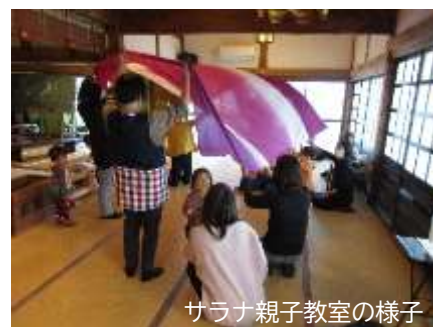
サラナ親子教室の様子